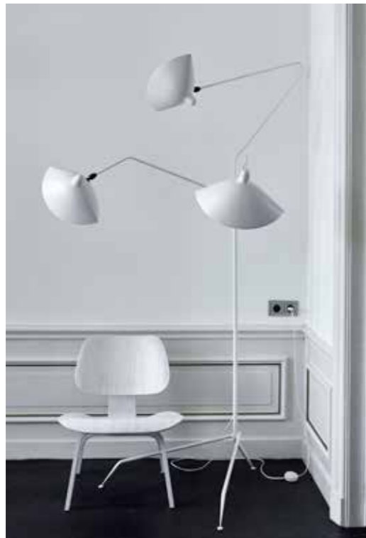
∨ Stoel Plywood Vitra, witte stalamp Serge Mouille.