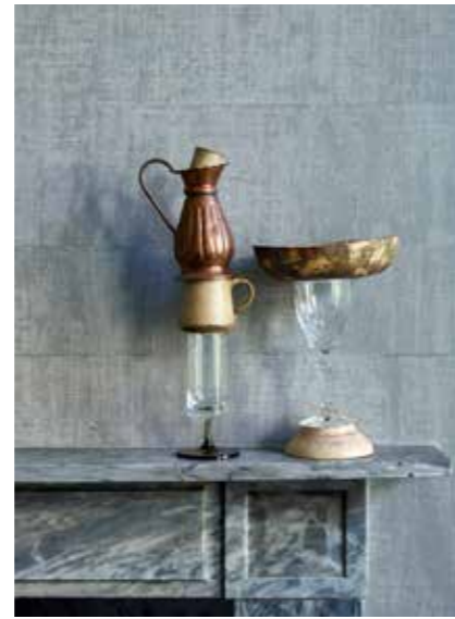
< Behang Atelier d'Artiste Elitis via Loggere Wilpower. De marmeren schouw is een originele Rococo-schouw. Vazen van Vazen van Janssen.